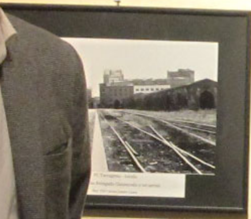
La Raffineria di Sesto e l'Industria Chimica del petrolio del 1930