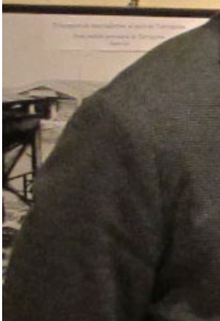
Prodotto di raffinazione in un'industria della ANIP a S. Donato Milanese