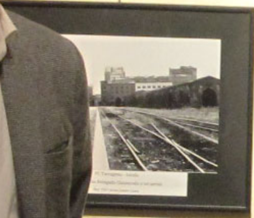
La Raffineria di S. Donato Milanese, l'industria di raffinazione della ANIP