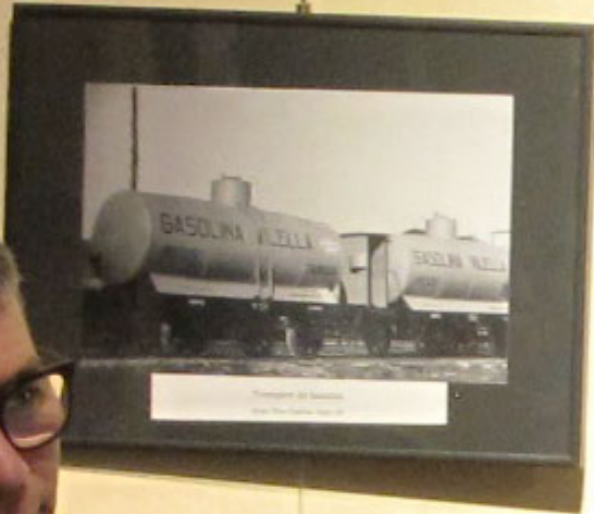
Trasporto di Gasoline con i Treni della ANIP