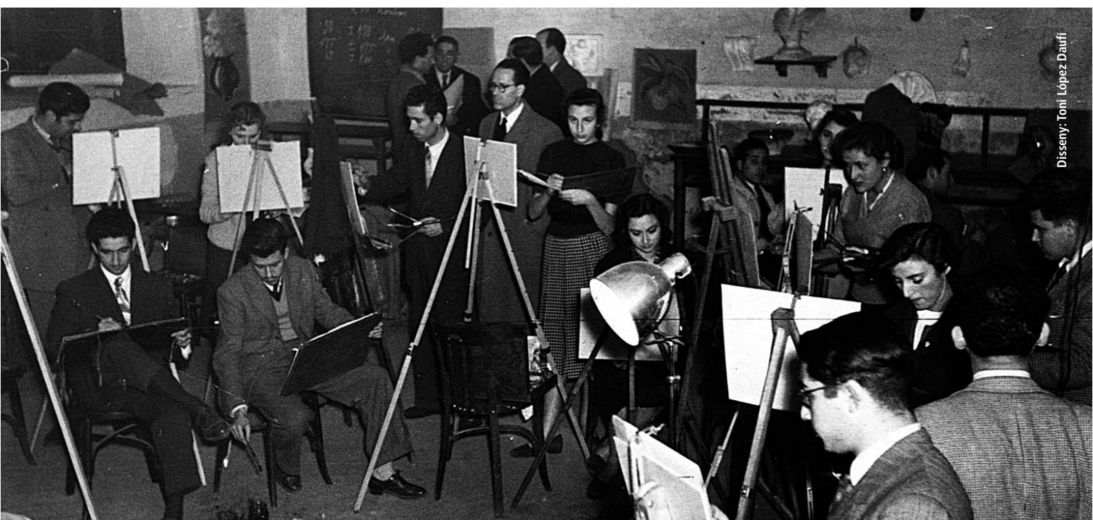
Disseny: Toni López Daufí

Aquesta ruta arquitectònica, que enguany arriba a la seva 6a edició, tindrà lloc els matins dels dies 1 i 2 d'octubre de 2022; és oberta a tothom, gratuïta, guiada per arquitectes experts i organitzada en grups reduïts. Atès que les places són limitades, caldrà inscriure's per telèfon (977 44 19 72) o via correu electrònic ( secr.tor@coac.net ), per tal d'assignar l'horari i el grup. Les imatges captades per tots els visitants es podran pujar a Instagram amb l'etiqueta #arquitectourebre2022