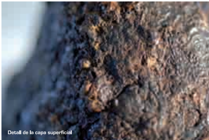
Detall de la capa superficial