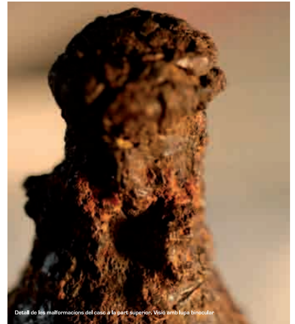
Detall de les malformacions del casc a la part superior. Visió amb lupa binocular