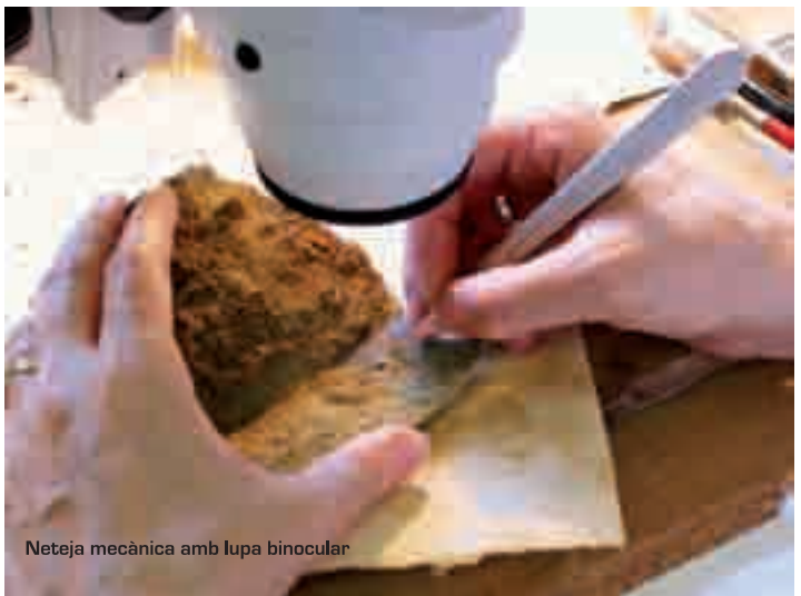
Neteja mecànica amb lupa binocular