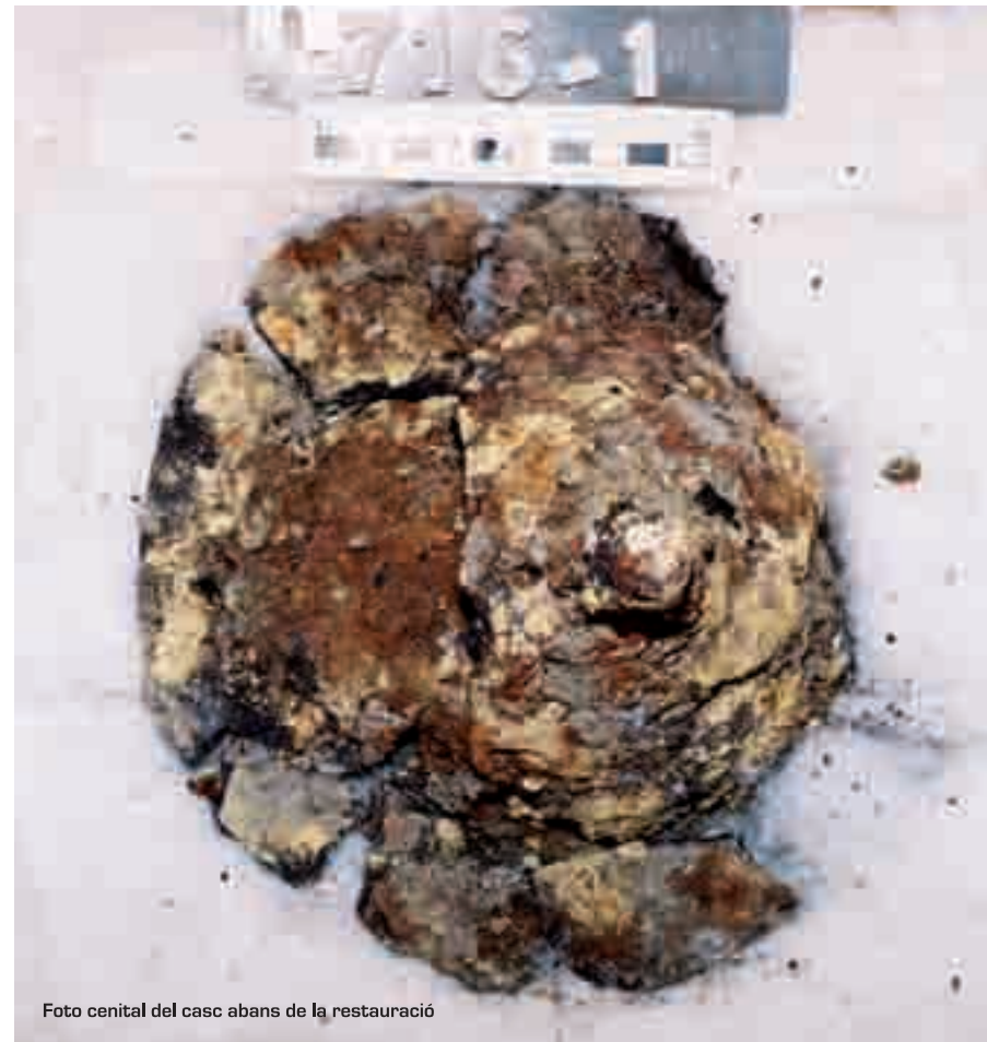
Foto cenital del casc abans de la restauració

Alguns trets morfològics i estructurals fan pensar que es tracta d'un casc militar de ferro d'època musulmana, anterior al 1148, data que Berenguer IV va conquerir la ciutat de Tortosa.