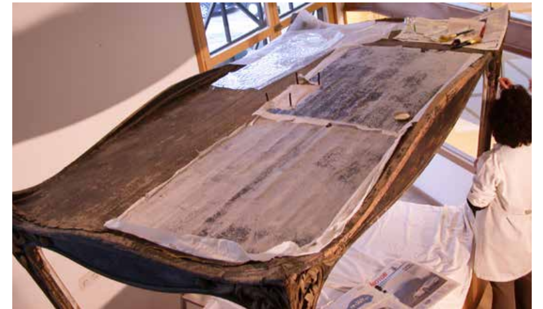
Fixació de la capa de lacat

L'estrat del lacat es va fixar per assentar els aixecaments, mitjançant un empaperat amb cola animal i espàtula calenta. Un cop s'aconseguí un bon assentament es va fer una neteja molt superficial amb aigua destil·lada i després es va aplicar una capa de vernís molt suau per equilibrar les lluentors. Les zones amb pèrdues de color es van reintegrar cromàticament amb un baix to, per tal d'unificar la lectura de l'obra.