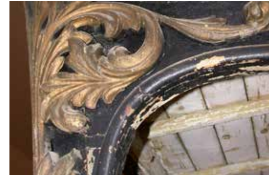
Repintats d'un element ornamental i pèrdues del lacat

Altres materials que formen part de la resta d'elements del carro són el ferro i el cuir. Destaquem la important capa d'oxidació i de brutícia dipositada damunt de les superfícies, propiciada per un perllongat abandonament. La peça va estar situada durant temps a la intempèrie i després dins de magatzems amb unes condicions ambientals adverses.