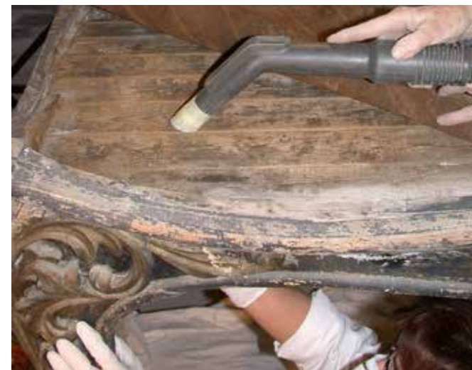
Neteja de la corbeta de la carrossa

Després es va realitzar una neteja general mecànica amb paletines i aspirador a baixa pressió. L'òxid de ferro es va eliminar també mecànicament, i es va protegir posteriorment el metall amb una resina acrílica.