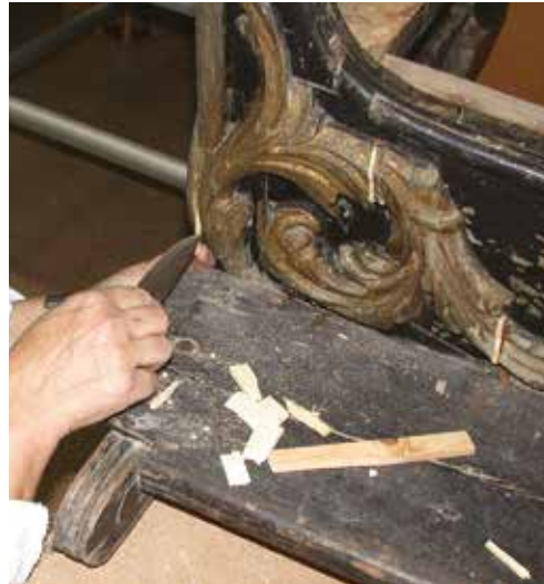
Reconstrucció de les pèrdues de fusta

Les pèrdues de suport de fusta es van reintegrar amb un estuc de serradures i cola, en el cas de petites zones atacades pels xilòfags, o bé amb empelts de fusta, en els llocs on les pèrdues eren més grans i perillava l'estabilitat de l'element.