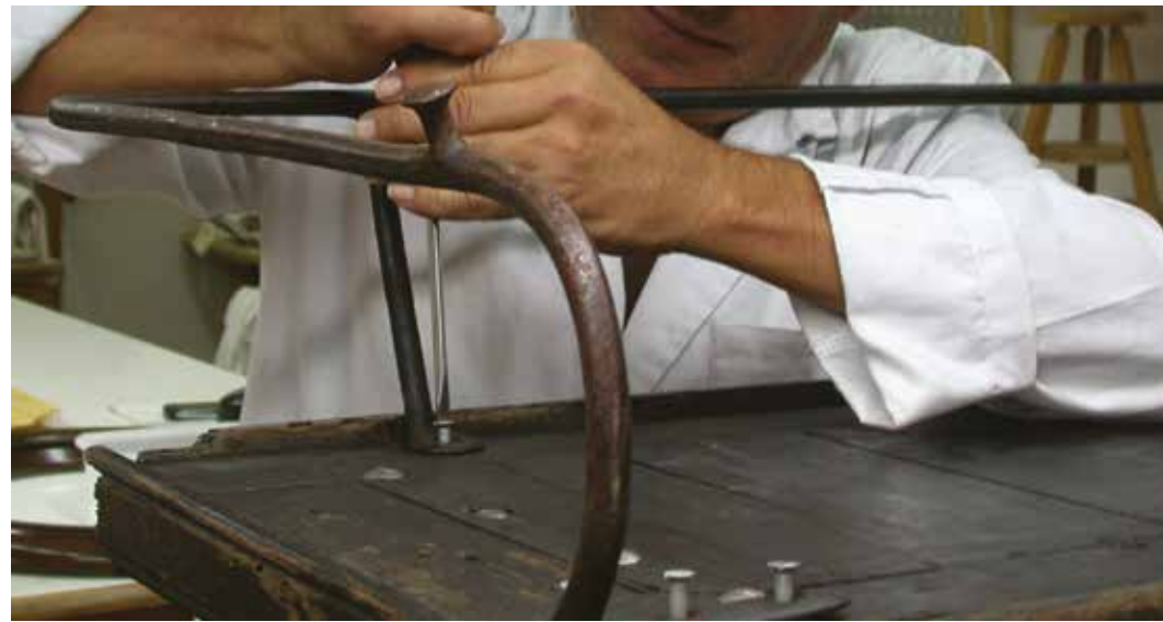
Muntatge del seient del carro

Els ornaments daurats presentaven fins a tres capes de daurat, realitzat amb diferents tècniques, que corresponien a tres intervencions anteriors. La restauració consistí en la neteja superficial i la reintegració cromàtica per mitjà d'un to neutre, a les zones amb alguna pèrdua. Es va decidir no eliminar cap capa de daurat, només es va deixar en un lateral inferior una petita mostra del daurat original.