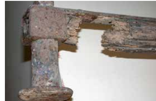
Fusta atacada pels xilòfags i oxidació dels elements de ferro