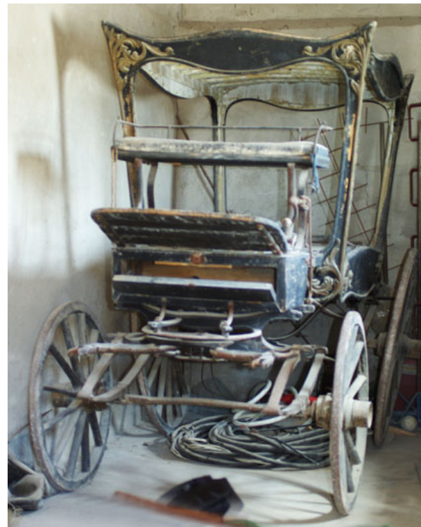
El carro funerari abans d'arribar a l'EAD Tortosa

Les fonts fotogràfiques d'arxiu han permès visualitzar com era l'aspecte original del carruatge fúnebre de Xerta, de manera que hi ha elements desapareguts i d'altres de canviats. Així doncs, sabem que hi manca la gran creu central que culminava la carrossa, i també que l'actual escut de la població no és el mateix que hi havia en el seu origen.