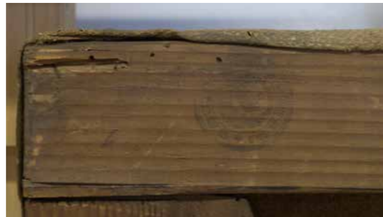
Ruptura i pèrdua al bastidor

La pintura presentava un estat de conservació regular. Així mateix, les alteracions més destacades eren les ruptures i pèrdues del bastidor, els forats i estrips localitzats majorment a les vores de la tela, els clivellats i les pèrdues a la capa pictòrica, les capes de vernís esgrogueït i la gran quantitat de brutícia i d'excrements d'insectes sobre la superfície. Cal dir que l'obra ja havia estat restaurada anteriorment.