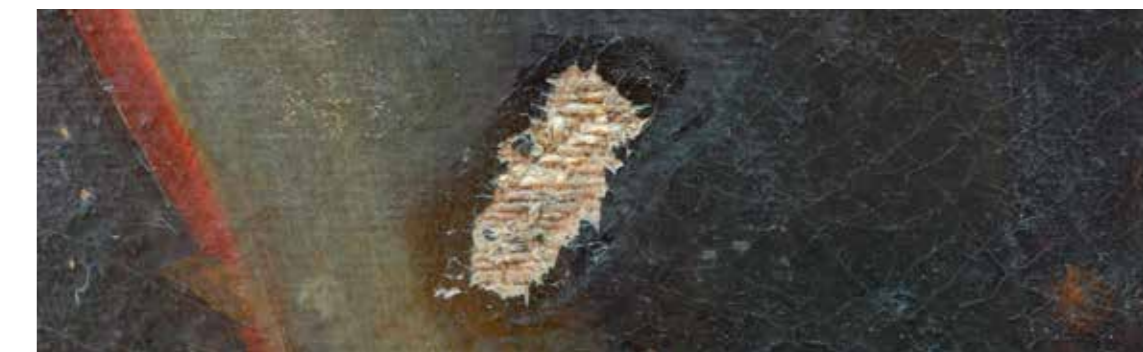
Forat consolidat amb el sistema fil per fil