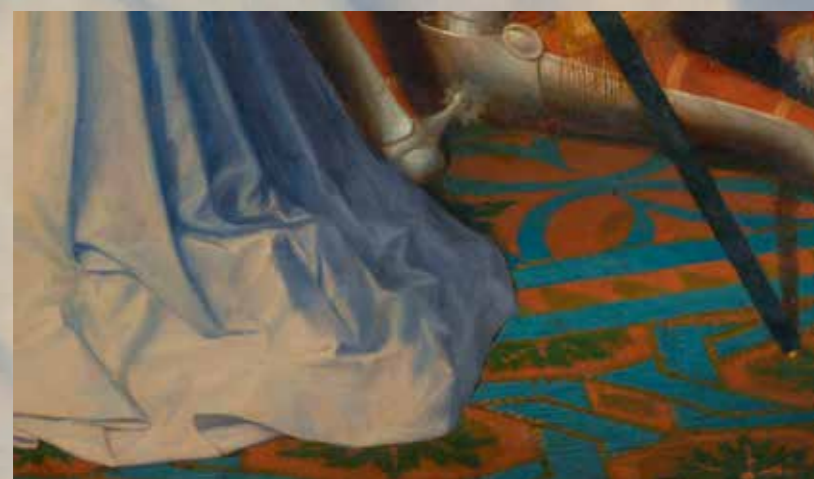
Després de la neteja