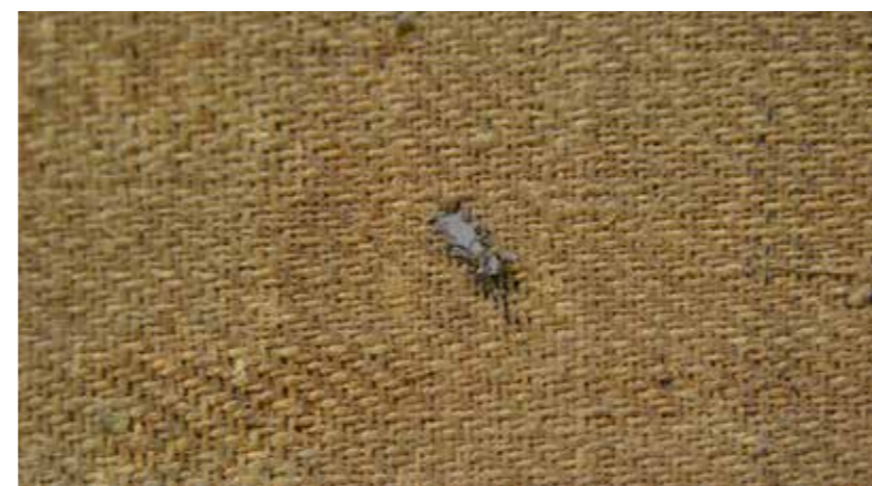
Forat a la tela