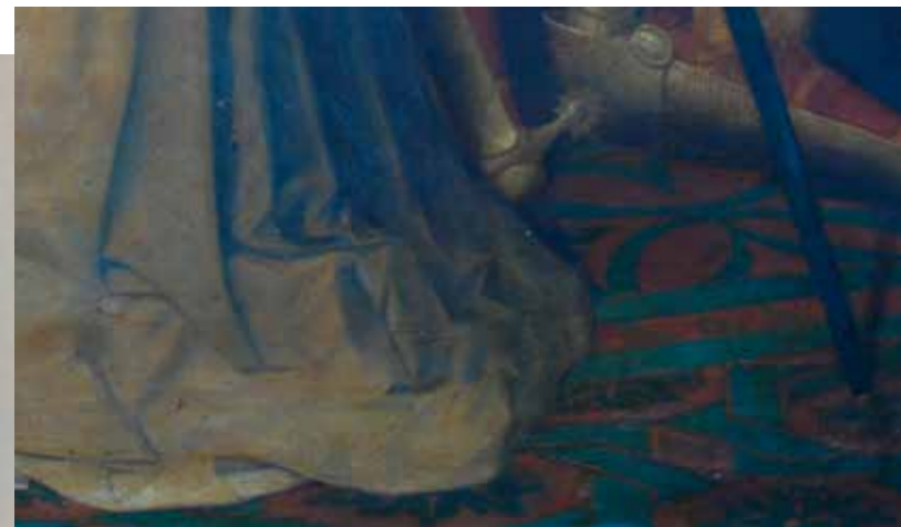
Abans de la neteja