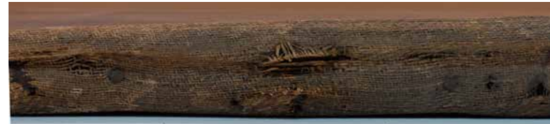
Forats a les vores de la tela