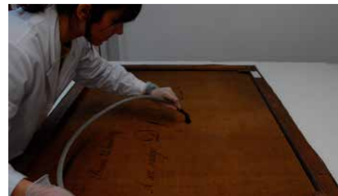
Neteja superficial del revers de la tela

Les intervencions de conservació i restauració que s'han dut a terme han permès garantir l'estabilitat de l'obra i facilitar-ne la lectura. Prèviament a aquestes intervencions es van realitzar estudis tècnics amb la finalitat de conèixer els materials i les tècniques i, a la vegada, decidir quin seria el tractament de restauració més adequat.