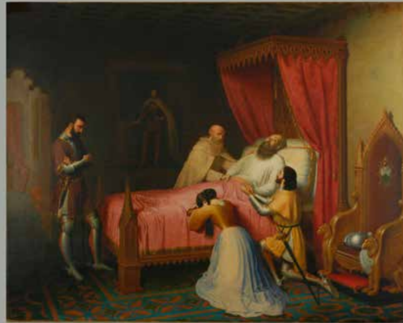
Pintura després de la intervenció

Miquel Fluyxench va pintar aquesta obra l'any 1847 durant la seva estada a Roma. El 1849 va ser mostrada a l'exposició anual de la Sociedad de Amigos de las Bellas Artes de Barcelona i figurava al catàleg de les obres exposades com a obra que no estava a la venda. Actualment és propietat del MAMT, que la va adquirir l'any 2013.