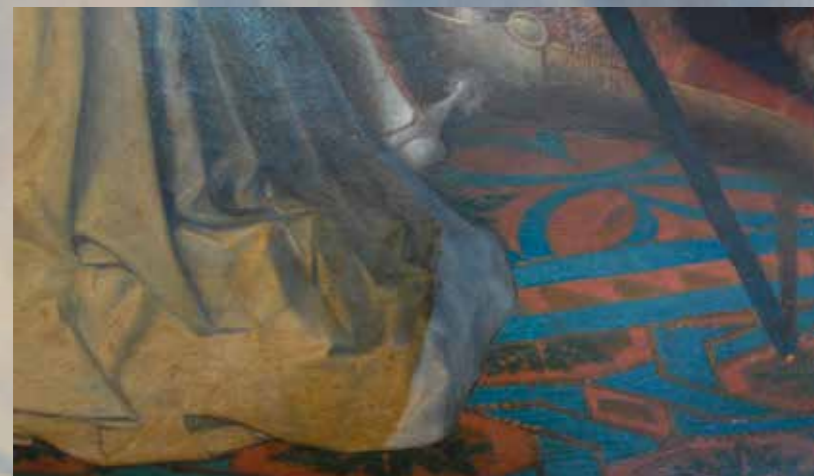
Durant la neteja