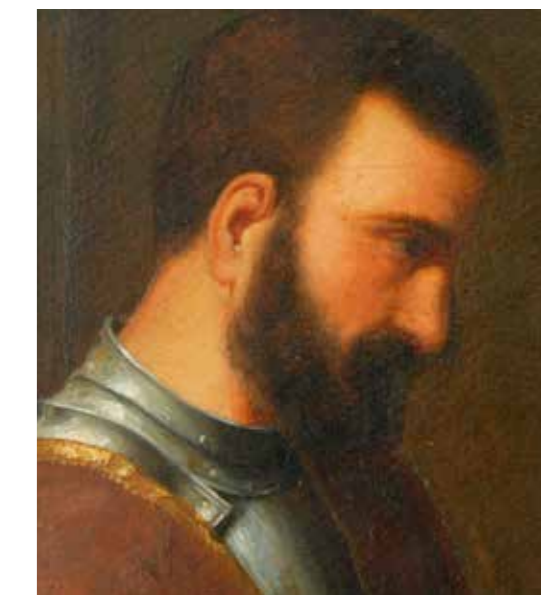
Detall després de la neteja