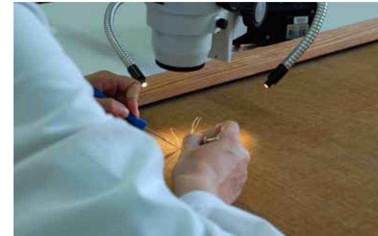
Consolidació del forat de la tela

Les intervencions van consistir en la neteja i consolidació del bastidor i de la tela, la fixació de la capa pictòrica, la neteja superficial, l'eliminació del vernís i de les repintades, l'estucat, la reintegració pictòrica i, finalment, l'envernissat.