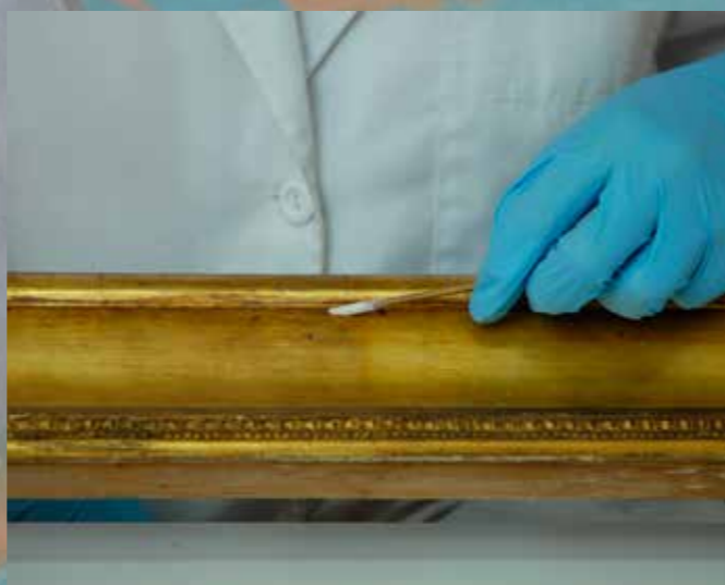
Neteja de la policromia

Les intervencions de conservació i restauració van consistir en la consolidació del suport, la fixació dels estucs, la neteja del suport i de la policromia, l'estucat i la reintegració pictòrica. També es va modificar la caixa del marc per tal d'assegurar una bona subjecció de l'obra i es va col·locar una protecció pel revers per tal de minimitzar les oscil·lacions d'humiditat relativa i de temperatura i aïllar el revers de la pols.